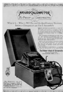
Izg: Neurocalometro, Dcha: quiropráctico utilizando el neurocalometro para detectar subluxaciones