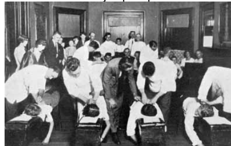
Clase de Técnica en la 1ª escuela de Quiropráctica

D.D fundó la primera escuela de Quiropráctica, la "Palmer's School of Chiropractic" (PSC) y la dejó a su hijo Barlett Joshua (B.J) cuando siguiendo una serie de persecuciones se mudó a California en 1902. B.J tenía sólo 20 años y acababa de graduar siendo uno de los primeros quiroprácticos. Pero B.J también era un hombre con carisma y determinación, y durante toda su vida se dedicó a desarrollar la profesión y divulgar en todo el mundo el mensaje quiropráctico.